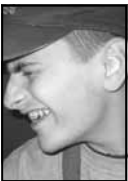
M.A. Numminen Laulaja