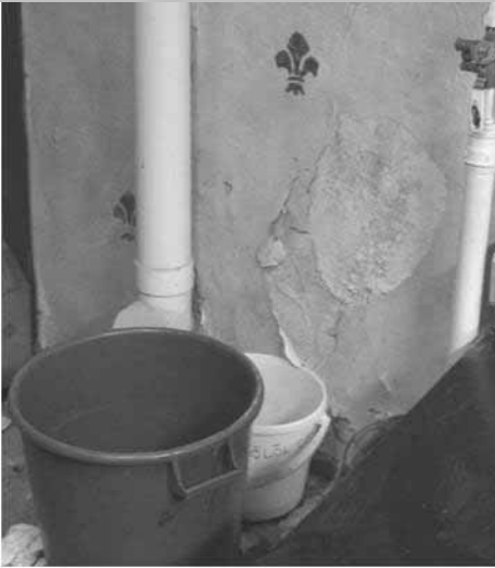
▣ Sudarihuoneen seinä.

onkin tarkoitus sijoittaa vielä nykyistäkin suurempi osa Tösin papereista. Wälikäsi on kuullut huhuja myös kommuutin mahdollisesta uudistamisesta, tilannetta seurataan.