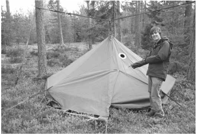
Hawu särmästi pystyssä.

Herättiin klo 8:00, söimme runsaasti aamupalaa ja lähdimme matkaan. oli ea-rastin vuoro, ja siel-