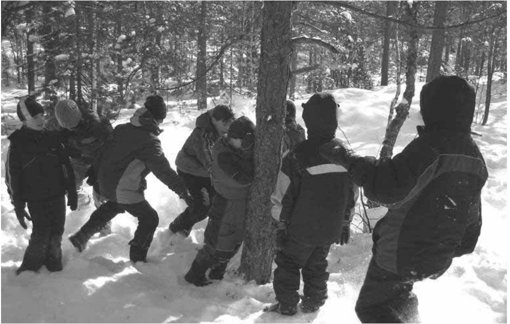
Pii-leikki oli suosittu ohjelmanumero.