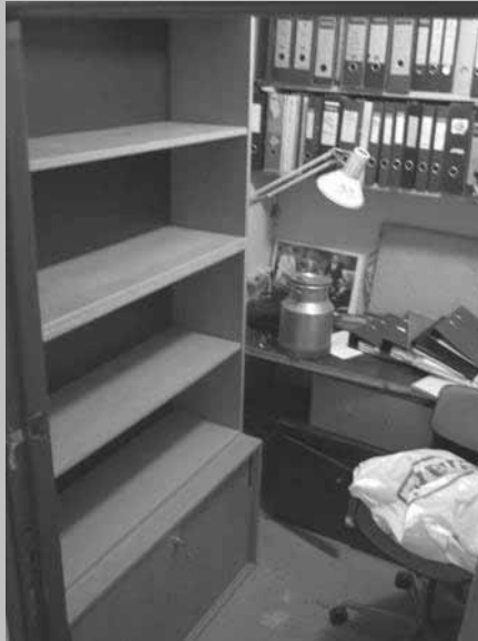
■ Toimiston uusi ulkoasu.

■ Hän on täällä jälleen. Mikään ei jää häneltä huomaamatta. Turha edes yrittää piiloutua tai piilotella, sillä sellaista juorua tai huhua ei olekaan, jota Wälikäsi, tuo mestarisalapoliisitoimittajamme, ei kuulisi. Ole siis varuillasi sillä Wälikäsi voi iskeä jopa nukkuesasi!