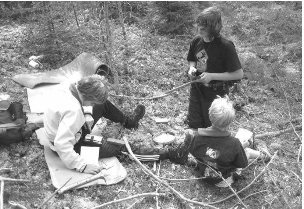
Flamencoyhtye Matador ilmoittautui rastille nro. 2, jonka aiheena oli puukon teroittaminen.