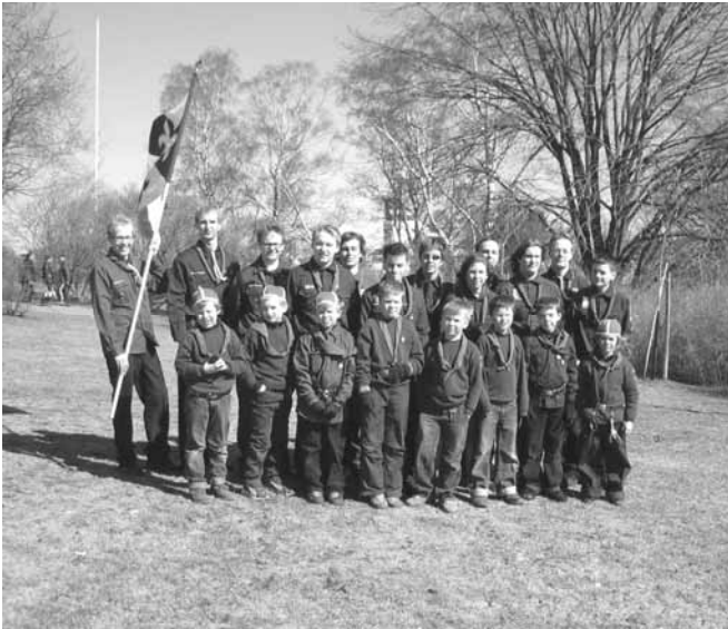
Tösin paraatiosasto yhteiskuvassa

H erään yhdeksän maissa kalseaan kännykän / veljen rähinään. ”Ainiin, tänään on paraati!” ajattelen, nappaamme aamupalan, partiotakit niskaan ja ei kun mennoksi.