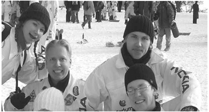
Nettisivutiimin jäseniä talvisessa maisemassa.

Tiedotus -osio kokoaa yhteen monta tiedotusai-