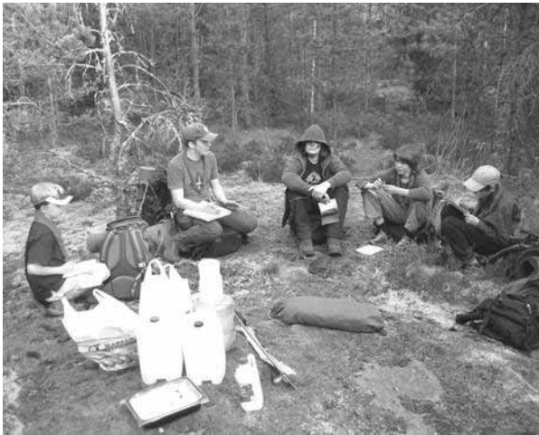
Vas: Koulutus aiheesta telttojen pystytys.