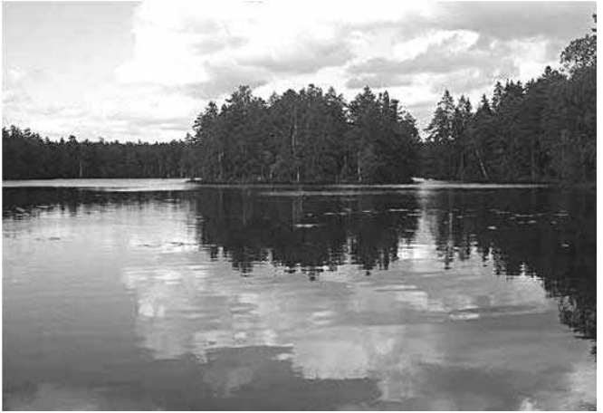
Nuuksion Holma-Saarijärvi, VJ-kurssin näyttämö.

parissa. Ystävyyttä rakennettiin myös yli rajojen. Helsingin Erämajavista oli nimittäin paikalla henkilöitä, joihin tulemme varmaankin jatkossa olemaan yhteydessä.