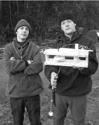
Väsyneinä mutta onnellisina muflonit esittelevät yörastin aikaansaannosta.

Matka jatkui neljännelle, liikuimme yhä yhdessä vitsailien jälleen samoista hahmoista. Neljännellä rastilla kyseessä oli Ensiapurasti, joka oli varsin typerä. Mentiin vain ja vastailtiin kysy-