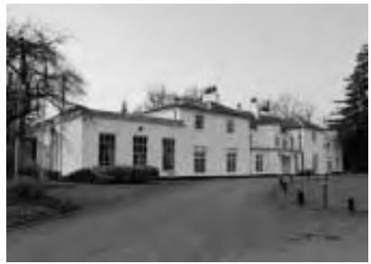
Baden-Powell House Lontoossa on eräs maailmanjärjestön kurssikeskuksista.

maailmankomitea toimeenpanee sen päätökset. W O S M omistaa useita toimipaikkoja ympäri maailmaa, mm. Kanderstegin partiokodin Sveitsissä, Lontoossa sijaitsevan Baden-Powell Housen sekä Kairossa sijaitsevan kansainvälisen keskuksen, joissa partiolaiset voivat työskennellä ja tarvittaessa majoittua.