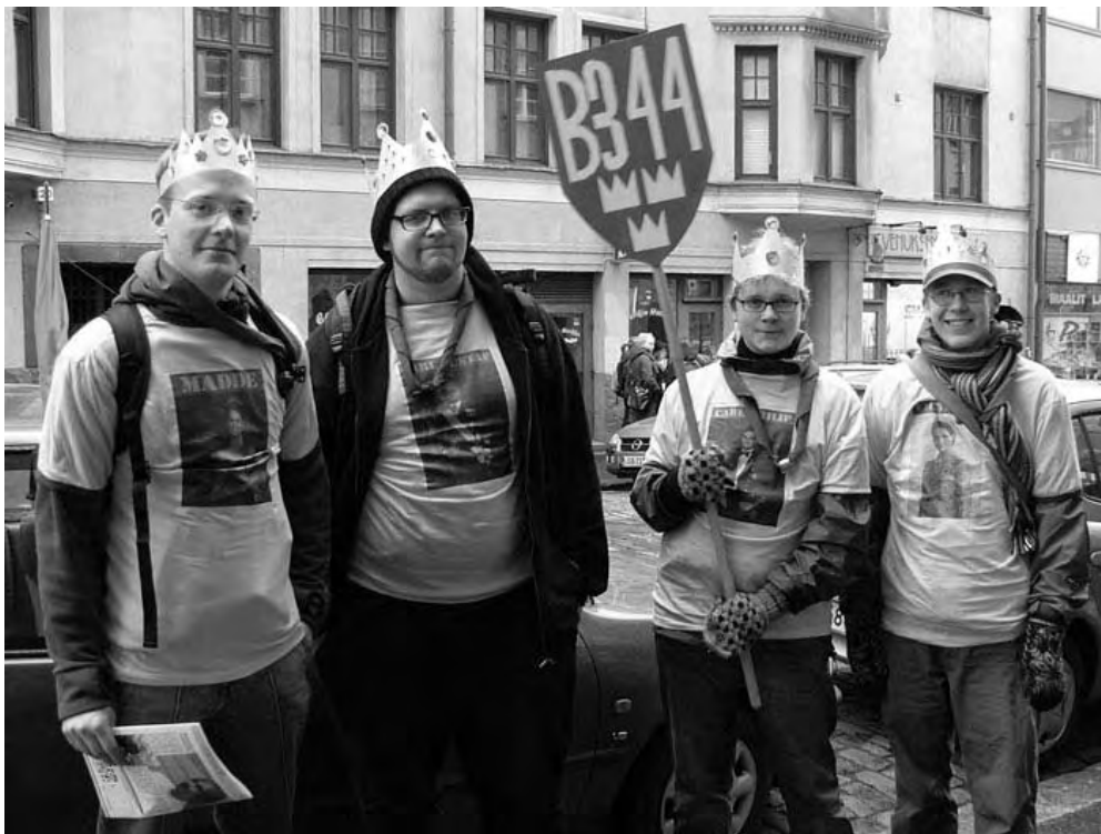
Kettujen lisäksi Tösiä edustivat Muflonit (kuvassa) ja kyyhkyläiset.