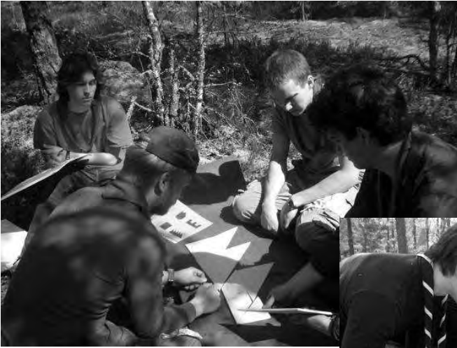
Ralf valvoo silmä kovana käsillä olevan vartion suoritusta.

Toukokuun puolen välin tienoilla kävi Tösin urhea johtajaporukka pitämässä rastia Nuuksion erämaassa. Tapahtumahan oli Päpan kevät-pt. Rastilla kisailijat saivat mutustella hankalaa älykkyyspähkinää, jonka Tösin pojat tietysti itse keksivät heti. Sää suosi ja kaikilla oli kivaa, ja rasti sujui kerrassaan loistavasti. Ohessa kuvasarja rastin tunnelmista: