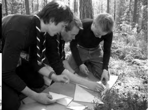
Harmaassakin sarjassa riitti jaksamista ja puhtia pohtia visaista pähkinää porukalla.