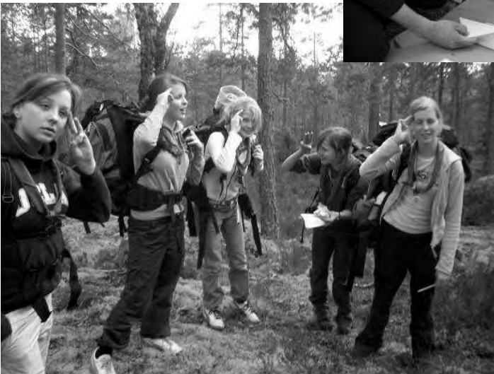
Paikalle osuneella tyttövartiollakin oli hyvä meininki, niin kuin kuvasta näkyy.