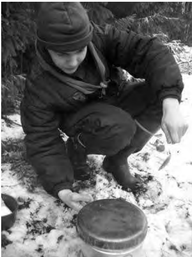
Töölön Sinisten ja Hesperton talvileiri 3.-6.1.2005

M issä olisikaan mennä tälläkään vuosituhannetollisempaa suorittaa Remppamerkki senegalilaisen terveysaseman ehostamiseksi kuin paikalla, Senegalissa? Siispä rallia Dakariin! Aivan leirin suunnittelun loppumetreillä leirin johto kuitenkin joutui toteamaan kalenterimyynnistä saatujen rahojen rajallisuuden: Dakariin ei