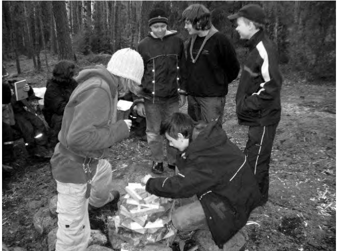
Nokkelat vartiolaiset pystyttävät nuotioita aikayksikön.